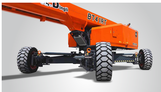
Nova tecnologia de expansão de eixo in situ de uma chave Proteção global de patentes