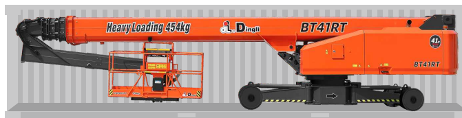
Transporte de contêineres padrão