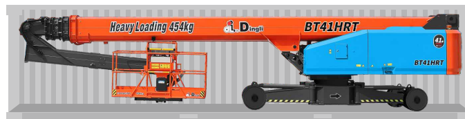
Transporte de contêineres padrão