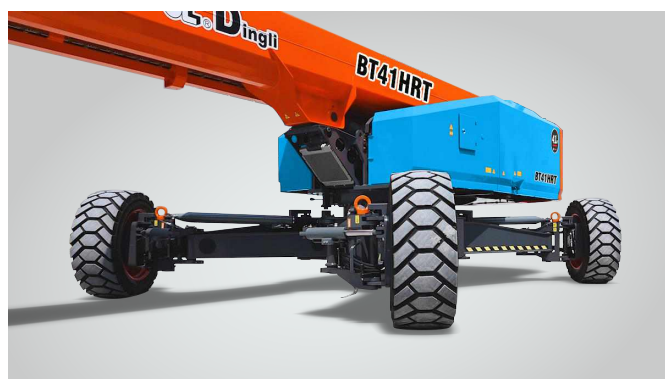
Nova tecnologia de expansão de eixo in situ de uma chave Proteção global de patentes