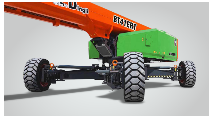
Nova tecnologia de expansão de eixo in situ de uma chave Proteção global de patentes