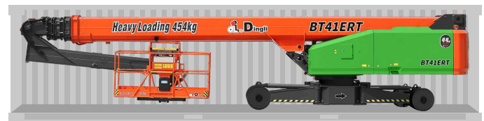
Transporte de contêineres padrão