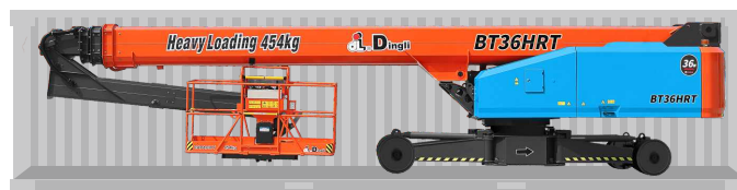
Transporte de contêineres padrão