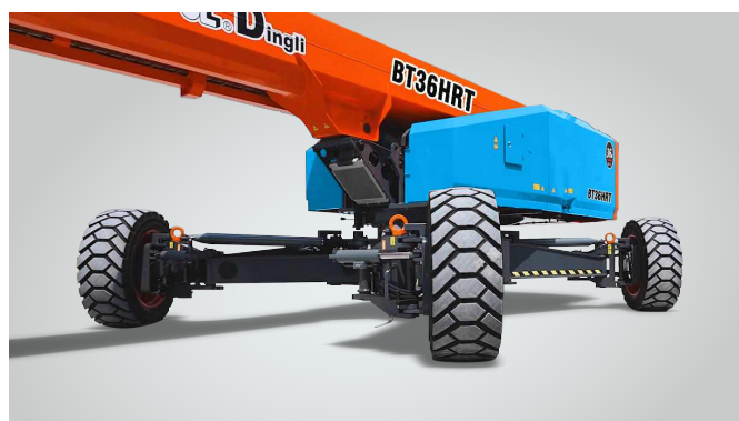
Nova tecnologia de expansão de eixo in situ de uma chave Proteção global de patentes