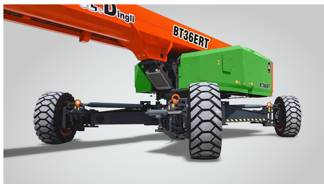
Nova tecnologia de expansão de eixo in situ de uma chave Proteção global de patentes