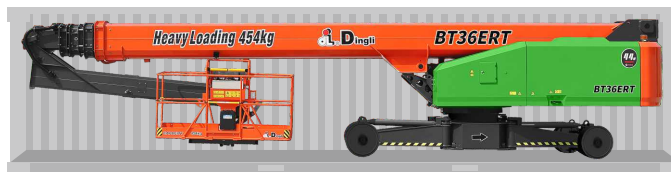
Transporte de contêineres padrão