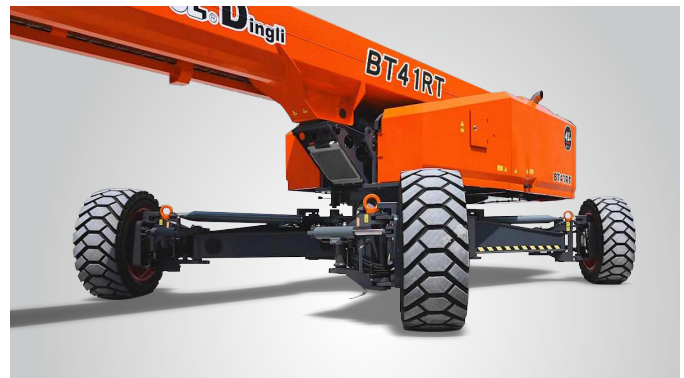
Gloednieuwe One-Key In-Situ Axle Expansion-technologie Wereldwijde octrooibescherming