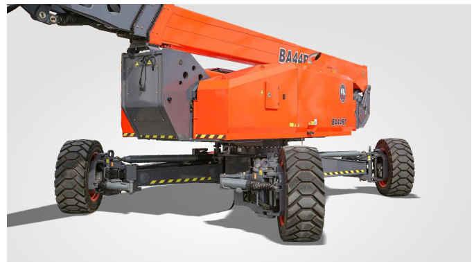
Gloednieuwe One-Key In-Situ Axle Expansion-technologie Wereldwijde octrooibeschermering