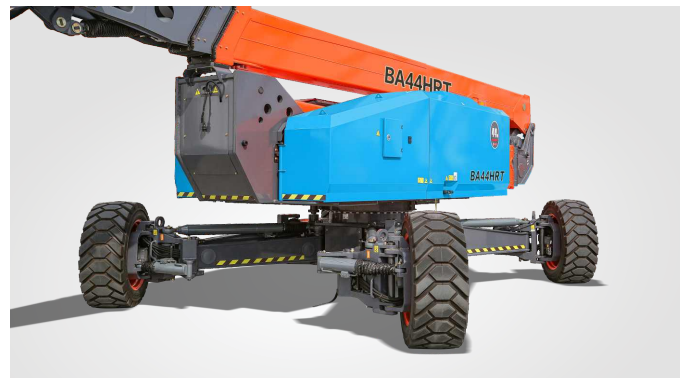
Gloednieuwe One-Key In-Situ Axle Expansion-technologie Wereldwijde octrooibeschermering