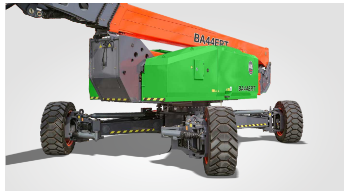
Gloednieuwe One-Key In-Situ Axle Expansion-technologie Wereldwijde octrooibeschermering